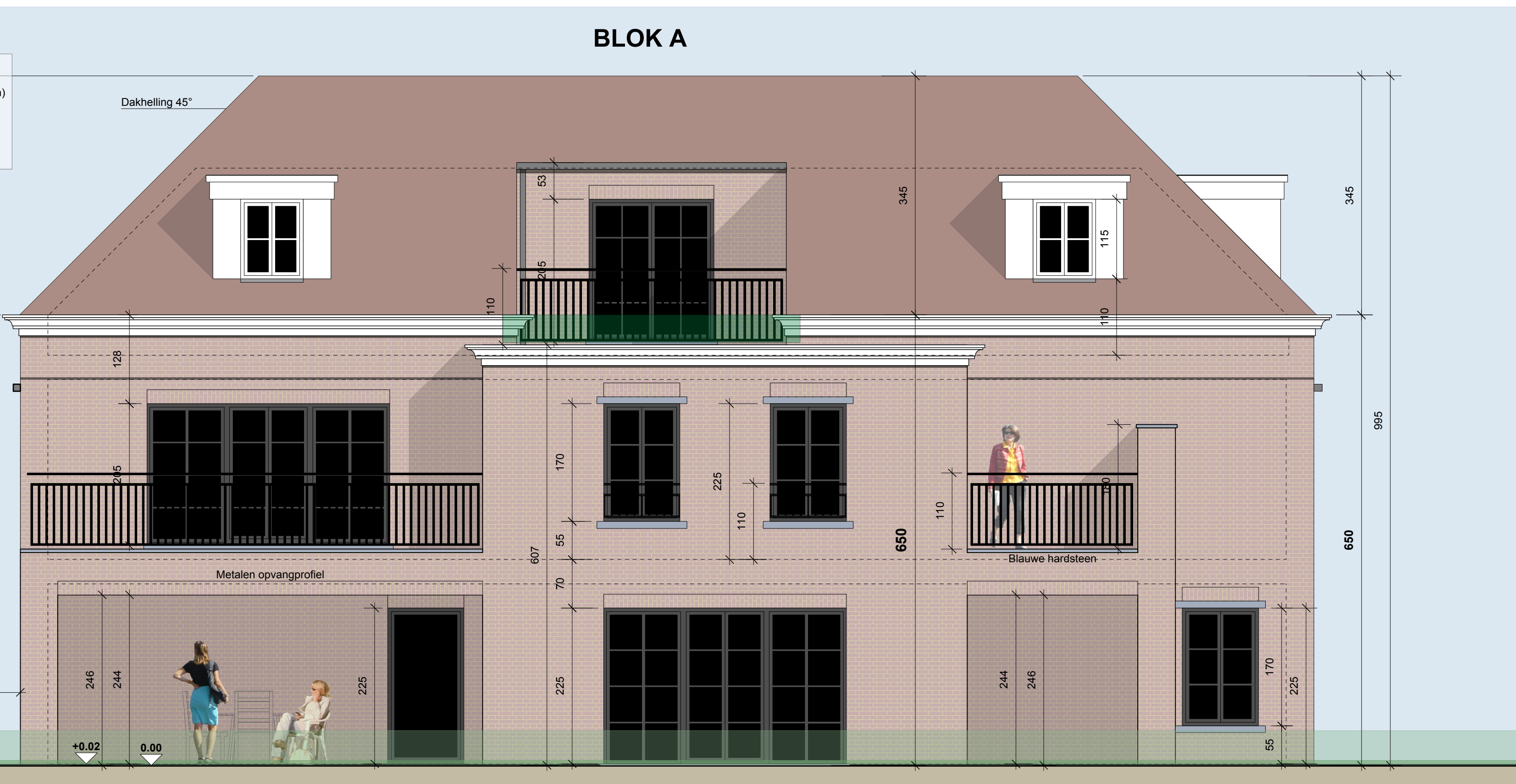
Achtergevelaanzicht blok A

Gevelmateriaal te bouwen meergezinswoning: Gevelmetselwerk in rood-beige handvoegmetselsteen (recuperatiesteen) Gedeelte wit geschilderde gevelsteen (blok A - voorgevel) Ramen in donkergrijs aluminium Dorpels, linten en plint in blauwe hardsteen Geperforeerde sierdakgoot, afwaterbuizen in donkergrijze zink Donkergrijze en rode gebakken dakpannen